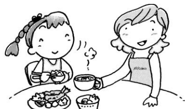
バランスのよい食事