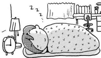
しっかり睡眠をとる