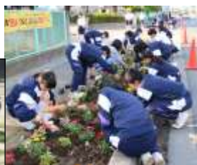
5月18日「お花組」の活動